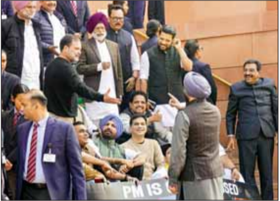
एजेंसी ॥ नई दिल्ली

केंद्रीय मंत्री बिट्टू ने राहुल गांधी को देश का दुश्मन कहा। बोले- राहुल फिट हैं पर मेरा हाथ भी बहुत भारी है