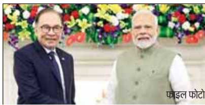
मलेशियाई पीएम दातो सेरी अनवर इब्राहिम और पीएम नरेंद्र मोदी

पीएम मोदी 7-8 फरवरी को मलेशिया की आधिकारिक यात्रा पर जाएंगे। इस दौरान वह मलेशिया के पीएम के साथ कई महत्वपूर्ण मुद्दों पर बातचीत करेंगे। भारतीय विदेश मंत्रालय के अनुसार पीएम मोदी को मलेशिया के पीएम दातो सेरी अनवर इब्राहिम ने आमंत्रित किया है। यह पीएम मोदी की मलेशिया की तीसरी यात्रा होगी और अगस्त 2024 में भारत-मलेशिया द्विपक्षीय संबंधों को 'व्यापक रणनीतिक साझेदारी' का दर्जा दिए जाने के बाद पहली यात्रा होगी। इस यात्रा के दौरान वे पीएम अनवर इब्राहिम के साथ द्विपक्षीय चर्चा करेंगे। पीएम भारतीय समुदाय के सदस्यों के साथ-साथ उद्योग और व्यापार प्रतिनिधियों से भी बातचीत करेंगे।