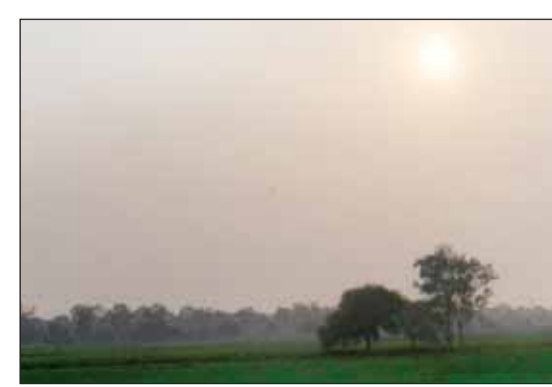
राजधानी में बड़खड़ा पटानी से कटारा हिल्स रोड का दृश्य, 4:15 बजे