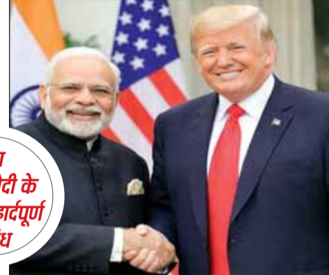
पीएम मोदी व राष्ट्रपति ट्रंप फाइल फोटो

भारत और अमेरिका के बीच नए व्यापारिक युग की शुरुआत हो चुकी है। सोमवार (02 फरवरी) को राष्ट्रपति डोनाल्ड ट्रंप ने भारत पर लगाया पारस्परिक टैरिफ 18 फीसदी कर दिया। इसी के साथ लंबे समय से अटके व्यापार समझौते पर भी ट्रंप ने सहमति जताई है। ऐसे में अब व्हाइट हाउस की प्रेस सचिव कैरोलिन लेविट ने भारत-अमेरिका के व्यापार समझौते पर जानकारी साझा की है। उन्होंने दावा किया कि पीएम मोदी ने अमेरिकी अर्थव्यवस्था में बड़े निवेश का वादा किया है। प्रेस सचिव कैरोलिन लेविट ने बुधवार को अमेरिका-भारत समझौते, अमेरिकी राष्ट्रपति डोनाल्ड ट्रंप और पीएम नरेंद्र मोदी के बीच सौहार्दपूर्ण संबंधों का जिक्र किया। लेविट ने दावा किया कि पीएम मोदी रूसी तेल की खरीद बंद करने और इसके बजाय अमेरिका और संभवतः वेनेजुएला से तेल खरीदने पर सहमत हो गए।