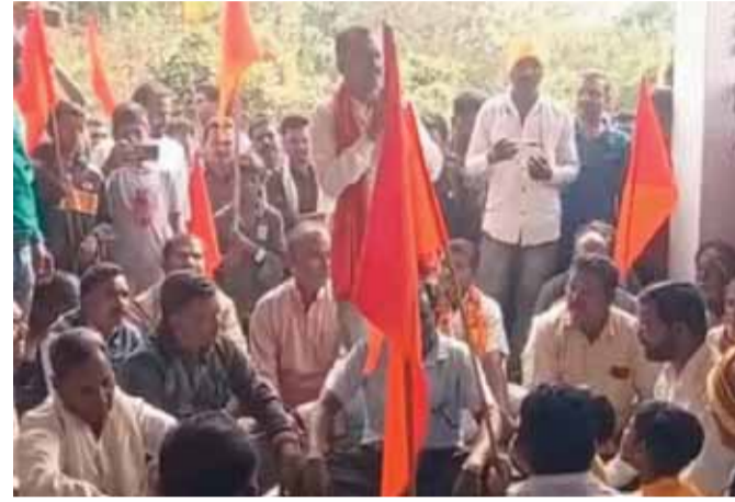
हरिभूमि न्यूज बालाघाट।