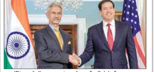
वॉशिंगटन में डॉ. एस. जयशंकर और मार्को रुबियो के बीच मुलाकात

भारत के विदेश मंत्री डॉ. एस. जयशंकर इन दिनों अमेरिकी दौरे पर हैं। इस दौरान उन्होंने अमेरिकी विदेश मंत्री मार्को रुबियो और ट्रेजरी सेक्रेटरी स्कॉट बेसेंट के साथ अलग-अलग बैठकें कीं, जिसमें भारत-अमेरिका रणनीतिक और आर्थिक साझेदारी पर व्यापक चर्चा हुई। विदेश मंत्री एस. जयशंकर ने मार्को रुबियो से मुलाकात के बाद सोशल मीडिया प्लेटफॉर्म 'एक्स' पर लिखा कि आज दोपहर अमेरिकी सीनेटर रुबियो से मिलकर बहुत खुशी हुई। हमारी द्विपक्षीय सहयोग एजेंडा व क्षेत्रीय और वैश्विक मुद्दों पर विस्तार से बातचीत हुई। भारत-अमेरिका रणनीतिक साझेदारी के जिन पहलुओं पर चर्चा हुई, उनमें व्यापार, ऊर्जा, परमाणु, रक्षा, महत्वपूर्ण खनिज और टेक्नोलॉजी शामिल थे। अपने साझा हितों को आगे बढ़ाने के लिए विभिन्न मैकेनिज्म की जल्द बैठकों पर सहमति बनी। विदेश विभाग के एक बयान के अनुसार, दोनों नेताओं ने महत्वपूर्ण खनिजों की खोज, खनन और प्रसंस्करण पर द्विपक्षीय सहयोग को औपचारिक रूप देने पर चर्चा की। यह एक ऐसा क्षेत्र है, जो भारत-अमेरिका आर्थिक और रणनीतिक संबंधों का एक केंद्रीय स्तंभ बनकर उभरा है।