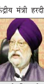
हरदीप सिंह पुरी

इसलिए कि एक पगड़ी वाला शख्स आपकी पार्टी छोड़ देगा, तो आप उसको गद्दार कह दोगे