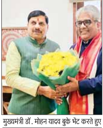
मुख्यमंत्री डॉ. मोहन यादव बुके भेंट करते हुए

मुख्यमंत्री डॉ. मोहन यादव ने असम से जंगली भैंसा मध्यप्रदेश लाने की सभी आवश्यक प्रक्रियाएं पूरी करने के लिए बुधवार को नई दिल्ली में केंद्रीय पर्यावरण, वन एवं जलवायु परिवर्तन मंत्री भूपेंद्र यादव से विभिन्न विषयों पर चर्चा की। मुख्यमंत्री डॉ. यादव ने कहा कि 28 फरवरी को बोत्सवाना से 8 चीते मध्यप्रदेश लाए जाएंगे। चीतों के पुनर्स्थापन के लिए केंद्रीय मंत्री यादव से आवश्यक सहयोग और व्यवस्थाओं पर भी विस्तृत रूप से बात की है। मुख्यमंत्री डॉ. यादव ने वन्य जीव संरक्षण और जैव-विविधता संवर्धन के लिए केंद्र सरकार के सहयोग के लिए आभार माना।