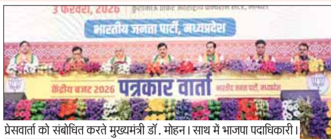
प्रेसवार्ता को संबोधित करते मुख्यमंत्री डॉ. मोहन। साथ में भाजपा पदाधिकारी।