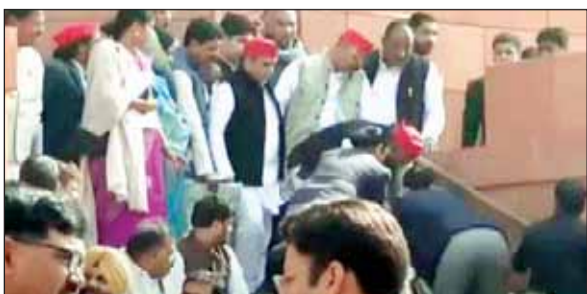
थरूर को सहारा देते विपक्षी सांसद

संसद परिसर में बुधवार को उस वक्त एक छोटा हादसा हो गया, जब कांग्रेस सांसद शशि थरूर सीढ़ियों से उतरते समय फिसलकर गिर पड़े। मौके पर मौजूद सांसदों और कर्मचारियों ने तुरंत उनकी मदद की। कांग्रेस सांसद शशि थरूर संसद भवन परिसर में सीढ़ियों से उतर रहे थे, तभी उनका